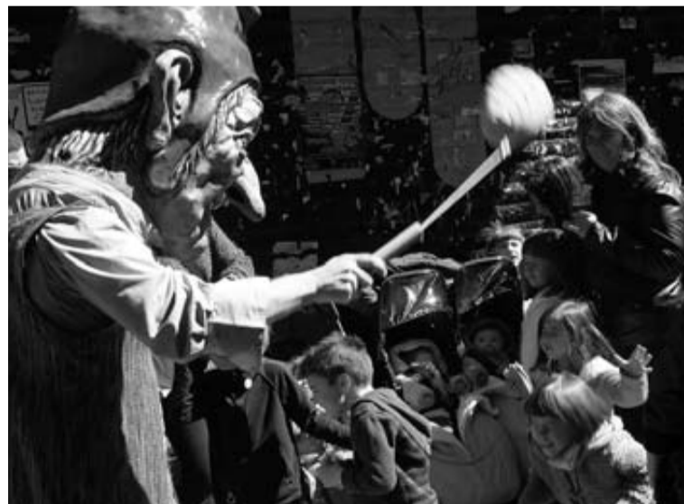
Uno de los cabezudos persigue con la botana a los niños.