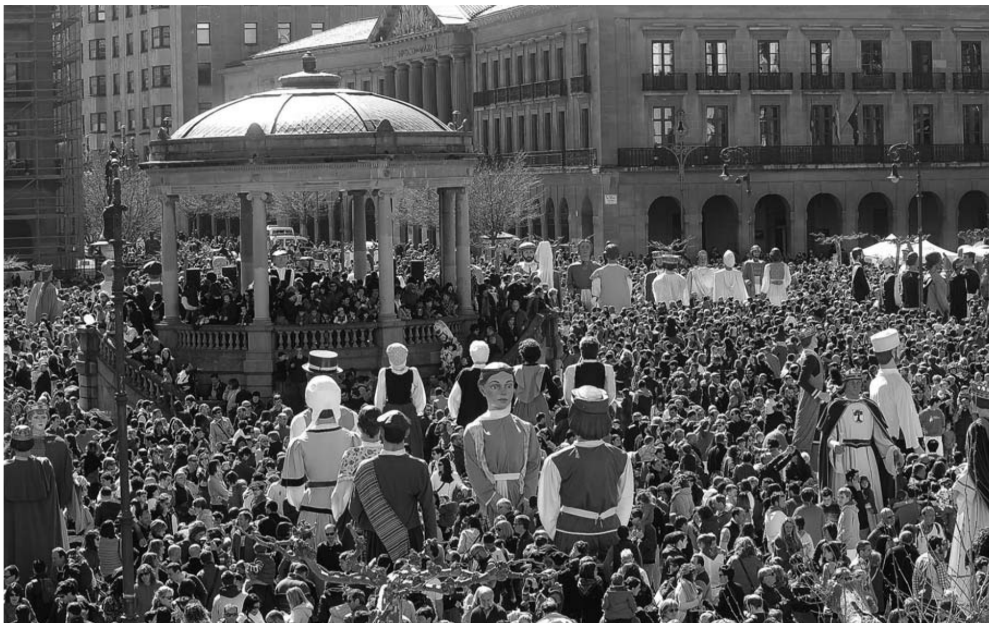
La Plaza del Castillo abarrotada ayer por miles de personas y más de un centenar de gigantes en el Día Mundial de Concienciación por el autismo.